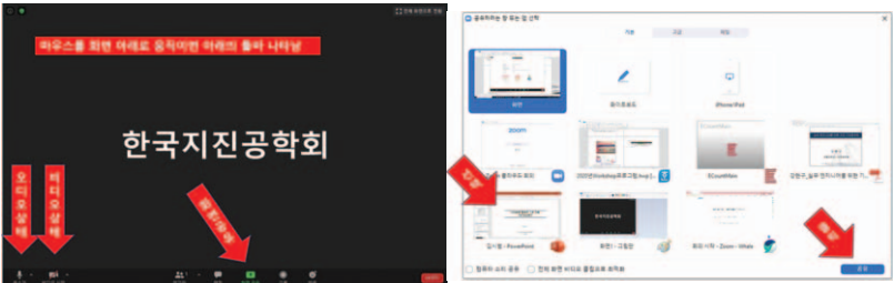
[ 오디오, 비디오 상태 확인 및 화면 공유 ]