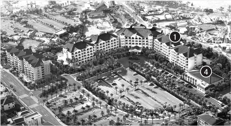
[ ①: TOWER A ④: 별관 ]